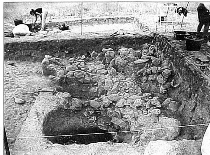
Εξαιρετικό επιστημονικό ενδιαφέρον παρουσιάζει η λίθινη κατασκευή που παραπέμπει σε σύστημα κυκλικών περιβόλων.

συγχρόνους τους, αλλά και με μακρινά μέρη, αφού χρησιμοποιούσαν οψιανό της Μήλου στις λιθοτεχνίες